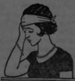
Para quitar el dolor de cabeza, oídos, muelas y cualquier otro dolor

Llévelas a la Fábrica Nacional de Licores HOY MISMO